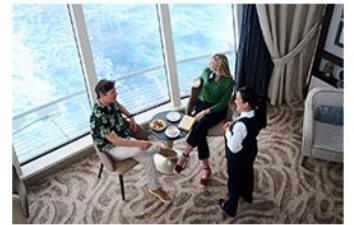
Premium amenities & service