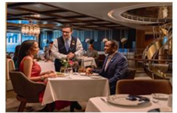
Your own private restaurant