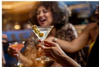
The perks of Princess Premier ®