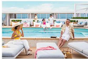
Exclusive access to the Sanctuary Club